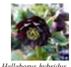
Helleborus hybridus 'Majolica'